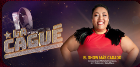
LA CAGUÉ (2021)