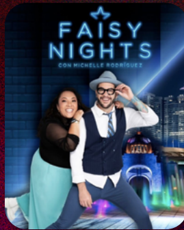
FAISY NIGHTS (2021)