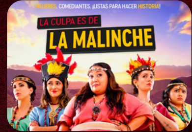
LA CULPA ES DE LA MALINCHE (2020)