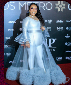
PREMIOS LOS METRO (2023)