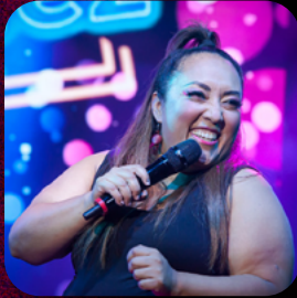
PREMIOS LOS METRO (2019)